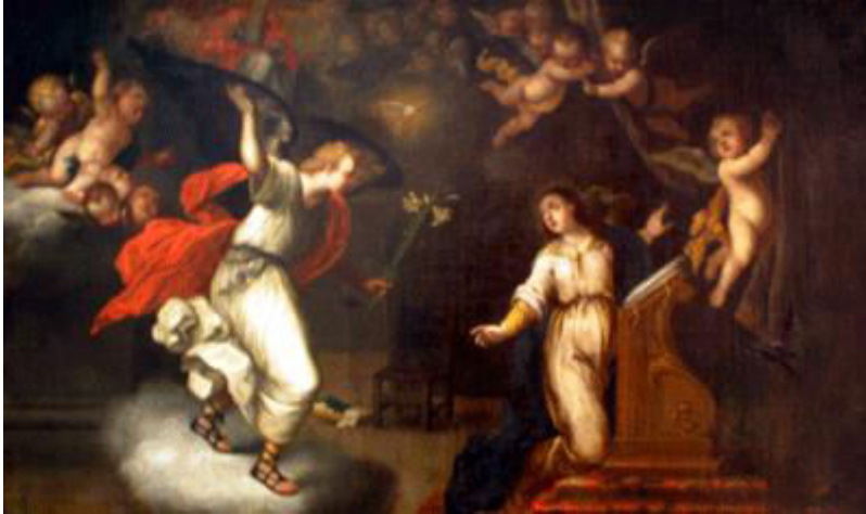
Senén Vila (Valencia, 1639-Murcia, 1707)

La escena de la Anunciación descrita por San Lucas en su Evangelio es una de las más repetidas en la historia del arte. Cada época ha dado su particular visión del hecho a través de los mejores pintores del momento, pero conservando siempre inmutables los símbolos que le son propios: el arcángel Gabriel, portando la azucena del amor puro y virginal, irrumpe en la estancia privada de María, que se encuentra orando de rodillas ante un atril. El Espíritu Santo ocupa el centro de la composición, en una habitación minuciosamente ordenada como alusión a la claridad de los proyectos divinos. El Barroco añade aquí, en el pincel de Senén Vila, los contrastes de luz y sombra y la teatralidad de los pequeños querubines sobrevolando la escena.